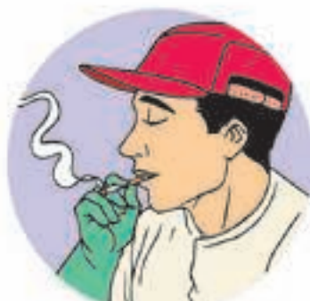
Oral – pela boca

A exposição pode ser classificada em exposição direta e indireta.