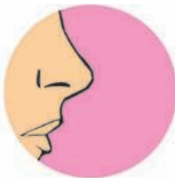
Respiratória – nariz e pulmões