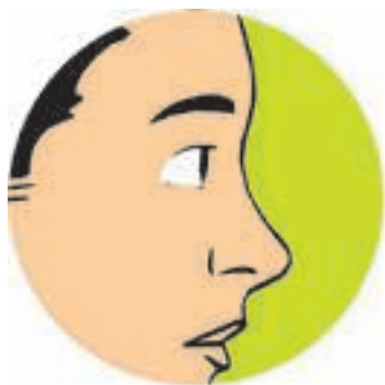
Ocular – pelos olhos

A exposição pode ser entendida como o simples contato do produto fitossanitário com qualquer parte do organismo humano. As vias de exposição mais comuns são: