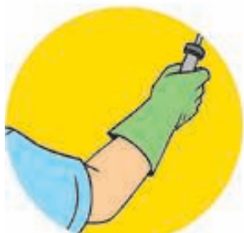
Dérmica – pela pele